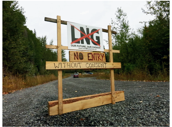
Au kilomètre 15 sur la route forestière de Suskwa (2014)

Plusieurs appels ont aussi été lancés pour des actions de solidarité et de sensibilisation . Déjà, d'un bout à l'autre du soi-disant Canada, différents groupes militants se mobilisent pour soutenir les gardien·nes du territoire de la Colombie-Britannique. Le projet est vulnérable, puisque le chantier a à peine commencé et subit de fortes oppositions. En 2020, le puissant mouvement Shut Down Canada s'est levé partout au pays contre le pipeline Coastal Gas Link en territoire Wet'suwet'en. Cinq ans plus tard, la lutte contre l'extractivisme colonial et écocide continue. Solidarité avec les Gitxsan et les Gitanyow !